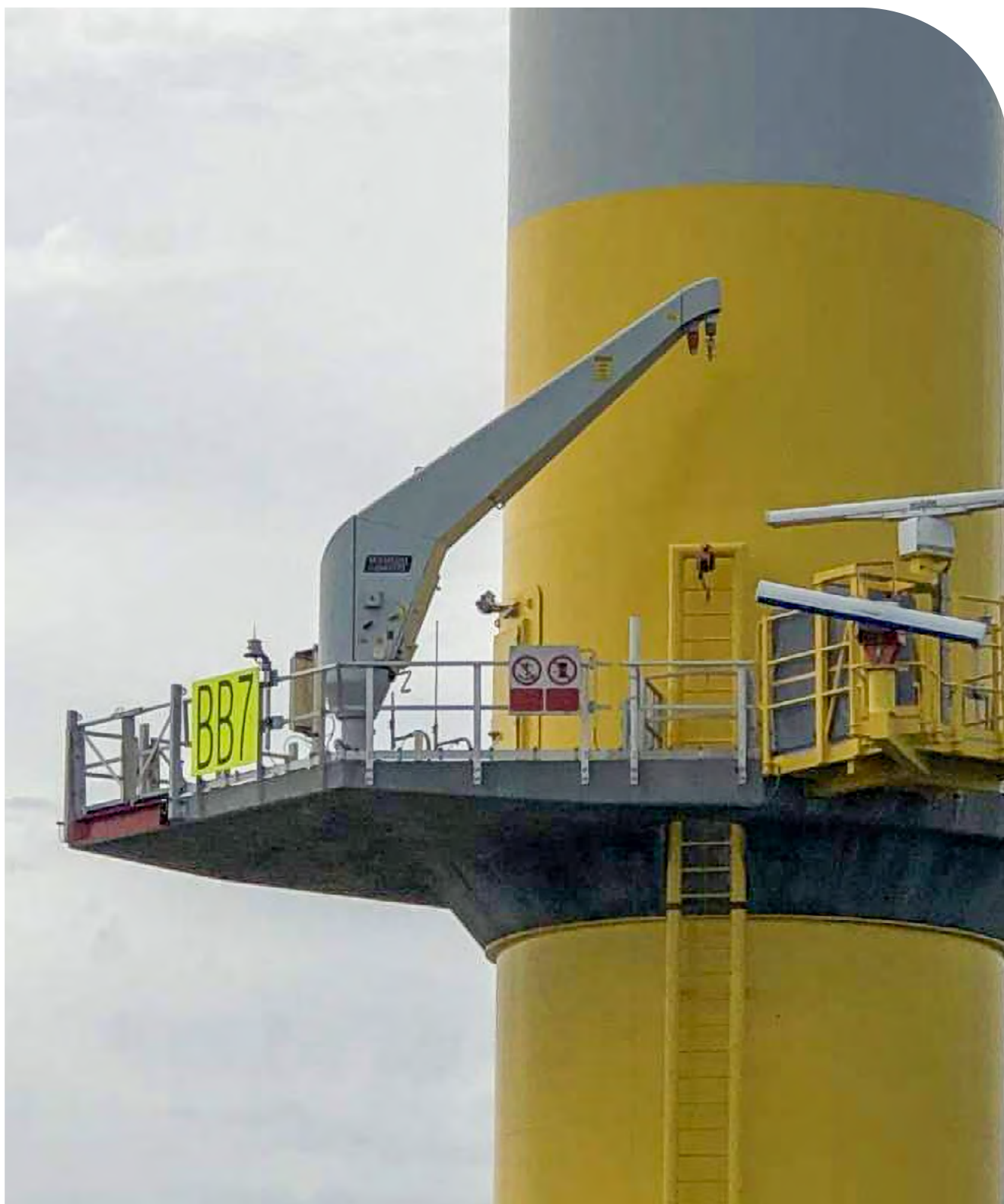
Vogelradars windpark Borssele