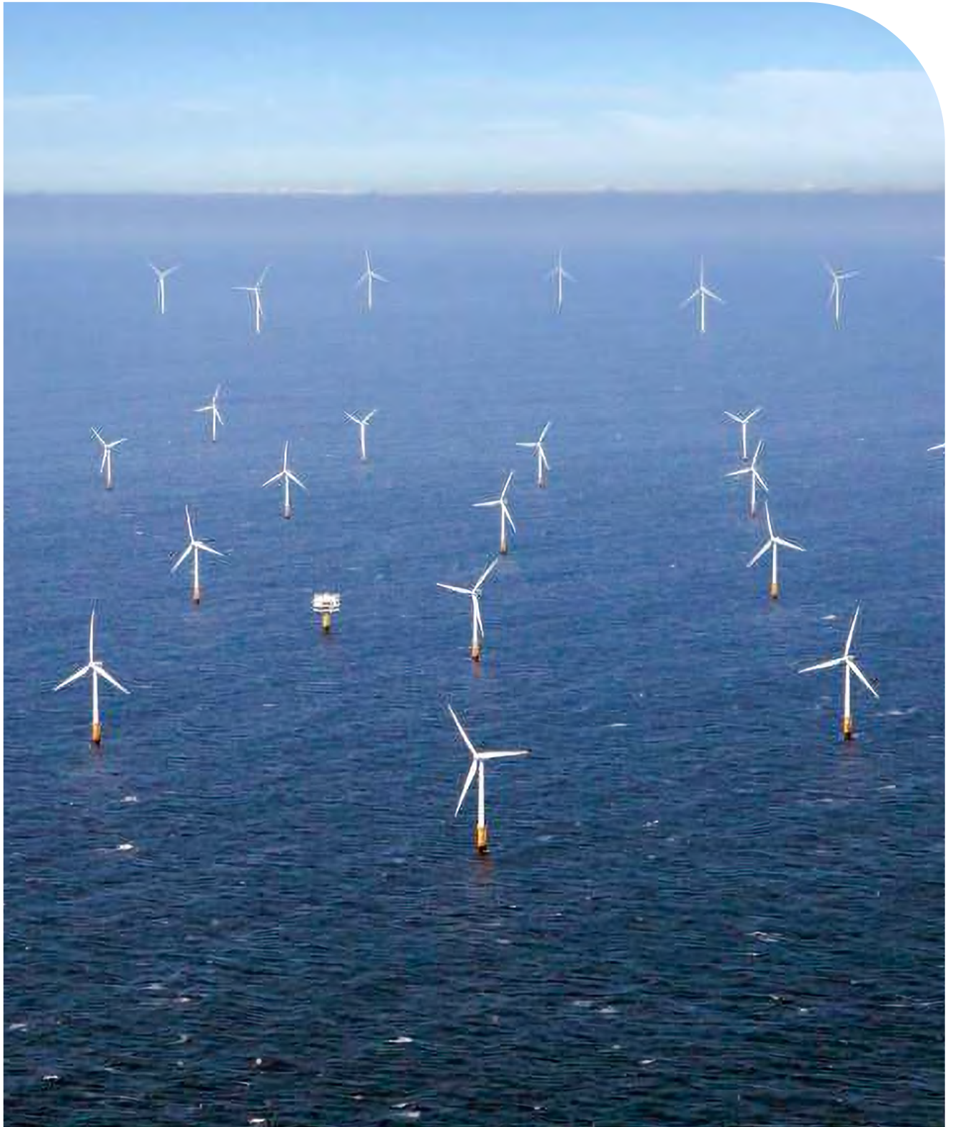
Windpark Hollandse Kust (noord)