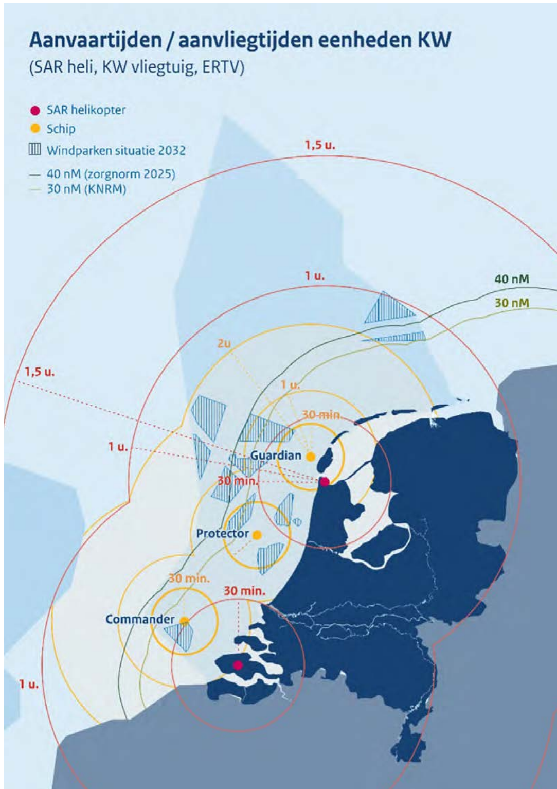
Figuur 2.0 Aanvaar en aanvliegtijden eenheden KW bij gunstige (weers)omstandigheden.4