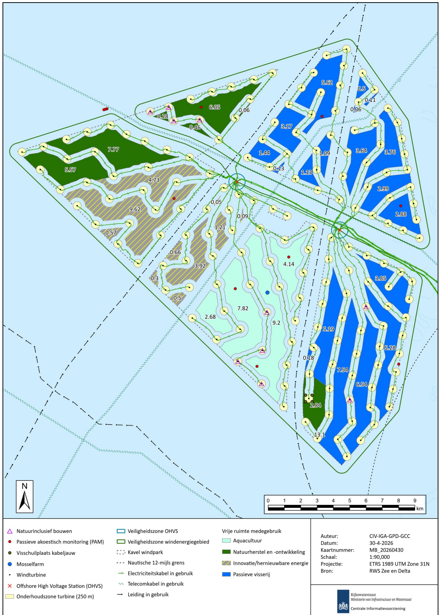
Figuur 1: Zoneringskaart handreiking gebiedspaspoort Borssele 2.0 met medegebruiksvoorkeursruimte in km 2 .